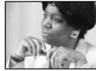
El manejo del Estrés