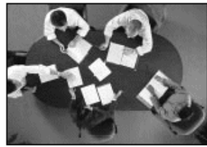
El Cambio Organizativo