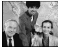
Un Lugar Sano del Trabajo

Afecciones reducidas del estrés Trabajadores satisfechos y productivos Organizaciones lucrativas y competitivas